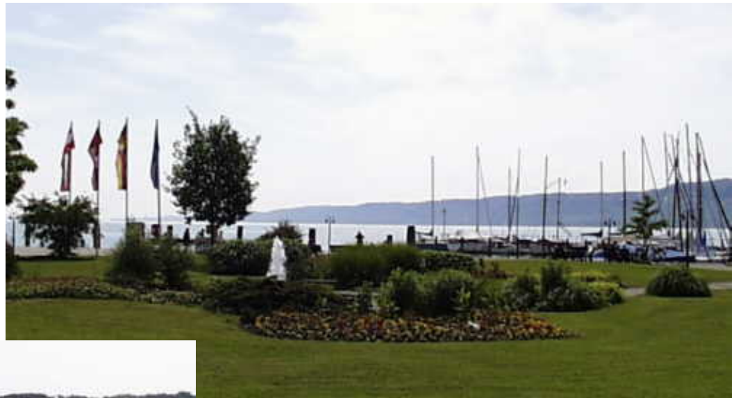
Park am Hafen