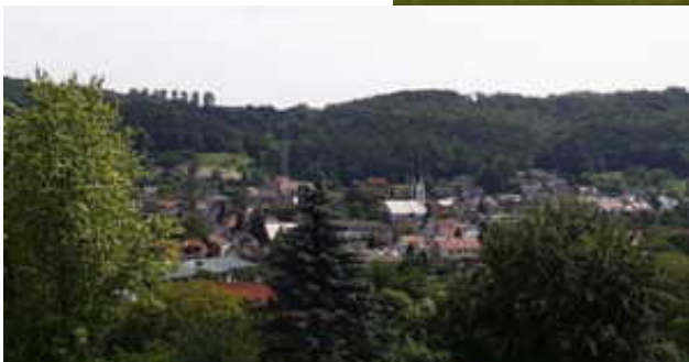
Blick auf Ludwigshafen